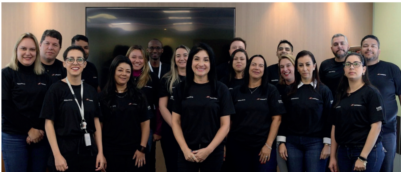
Parte do time de voluntários Manserv.

O trabalho voluntário e práticas solidárias estão alinhados aos Objetivos de Desenvolvimento Sustentável da ONU (ODS), pois englobam uma gama de causas que contribuem para o alcance dos ODS, como educação de qualidade, saúde e bem-estar, cidades e comunidades sustentáveis, dentre outros.