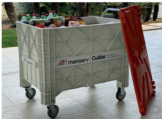
Doação de alimentos para o almoço de Dia das Mães 2023 do Lar Nossa Senhora das Mercedes promovida pelo Programa Cuidar.

Atualmente, o ranking é liderado pela Indonésia, seguido do Quênia, EUA, Austrália e Nova Zelândia.