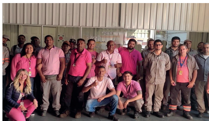
Colaboradores na UT EATON em Campinas - SP