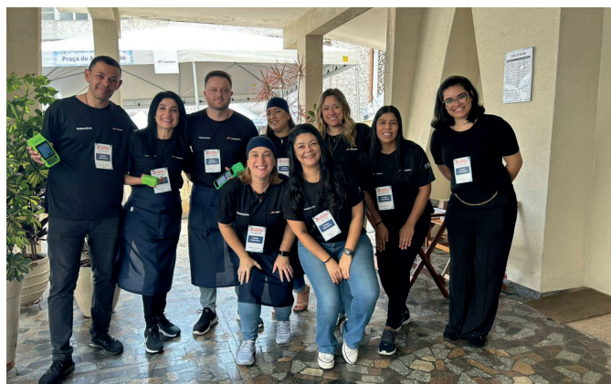
Parte do time de voluntários Manserv na 3ª Festa da Padroeira Santa Teresa Jornet.