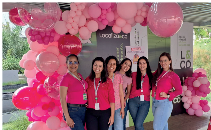
Colaboradoras na UT Localiza em Belo Horizonte - MG

Confira como foi o Outubro Rosa na Manserv: