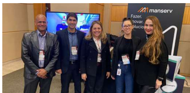
Infra FM: Equipe comercial da Manserv Facilities - Saúde no espaço para expositores no evento.