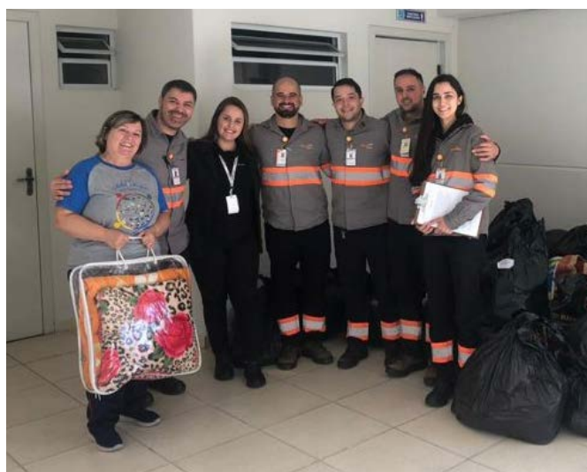
Colaboradores na UT Diamante Geração de Energia, em Capivari de Baixo/SC, entregaram 1.528 itens para a ONG CEACA.