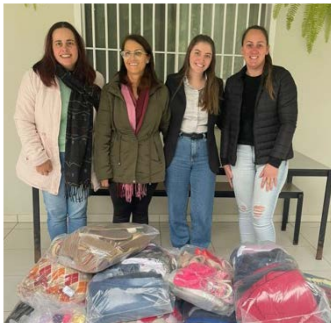
Colaboradoras da UT Braskem em Triunfo - RS com as arrecadações da campanha