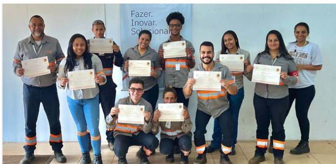
Colaboradores obtêm certificado do Game Mover na UT Anglo American - MG.