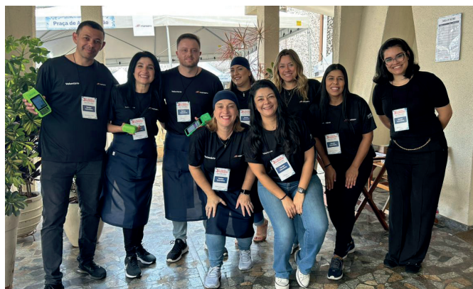
Grupo com alguns dos voluntários que trabalharam durante os três dias de evento.

Graças ao trabalho dessas e muitas outras pessoas a festa foi um sucesso e as metas estabelecidas em prol do Lar Nossa Senhora das Mercedes foram superadas.